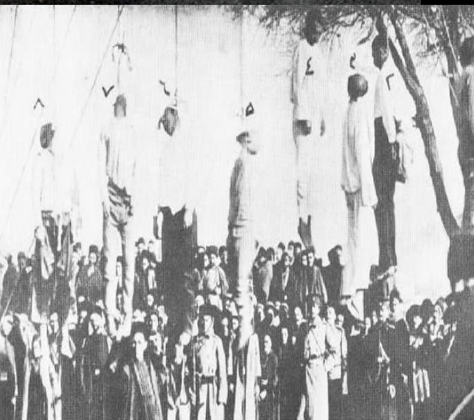
اولین کشتار روسها در تبریز (جنبه دهم محرم ۱۳۳۰ ه. ق.)